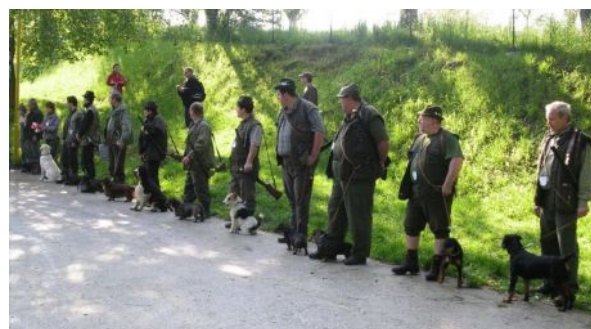
JZ Vloh Tečovice 19.5. 2007 - nástup